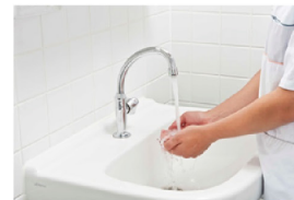
Handen nat maken