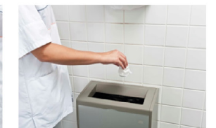
Gooi doekje weg