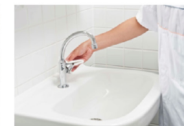
Sluit kraan met doekje