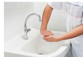
Met gesloten vingers