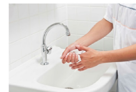
Droog vingers en rond de nagels