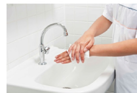
Droog handpalmen en rug