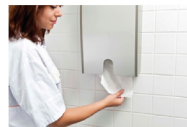
Droog de handen