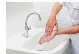
Met vingertoppen in handpalm